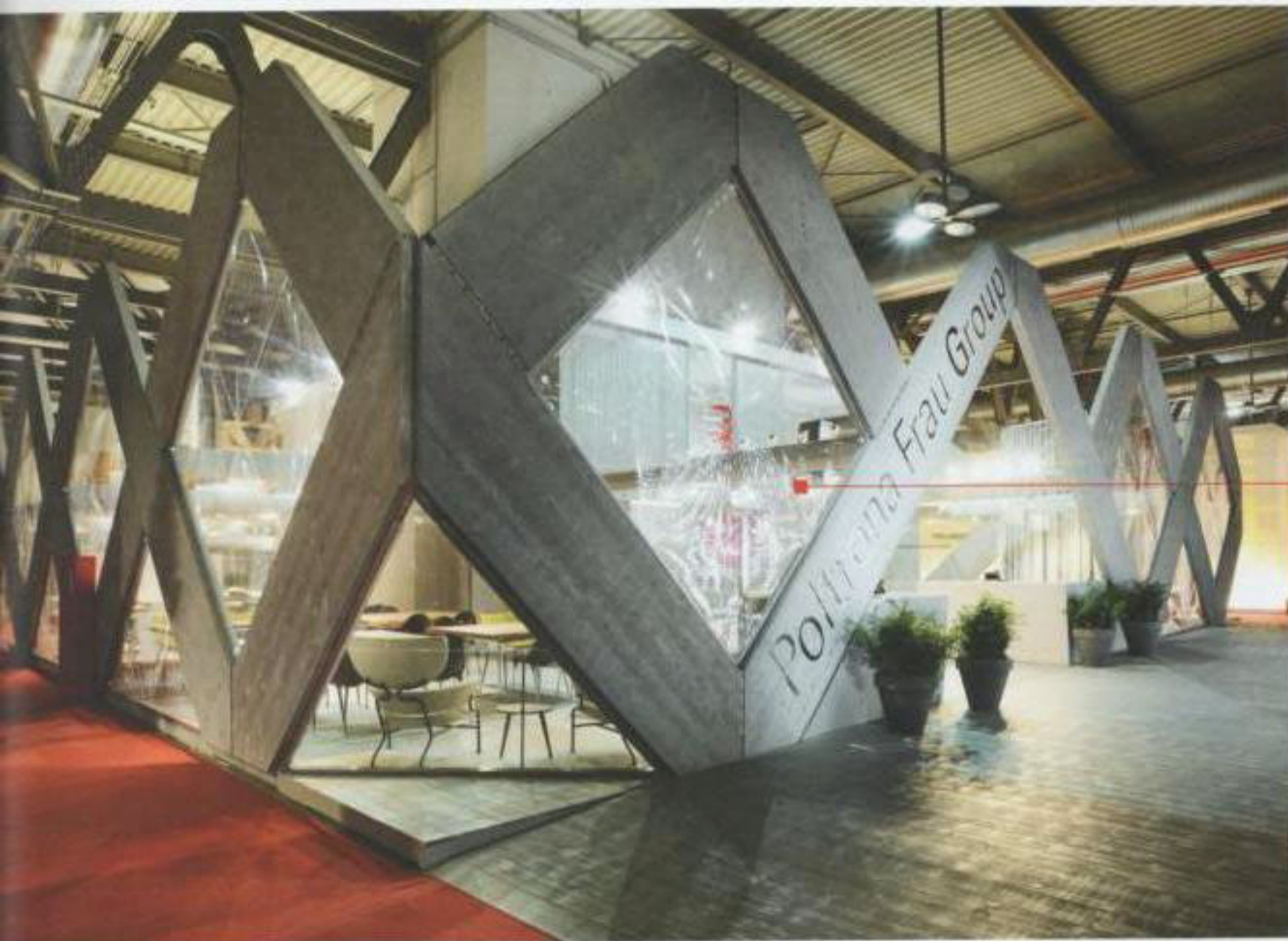
FACCIATE / WALLS TAMPONAMENTI CON PANNELLI TRASPARENTI PNEUMATICI. FILLED WITH TRANSPARENT PNEUMATIC PANELS.